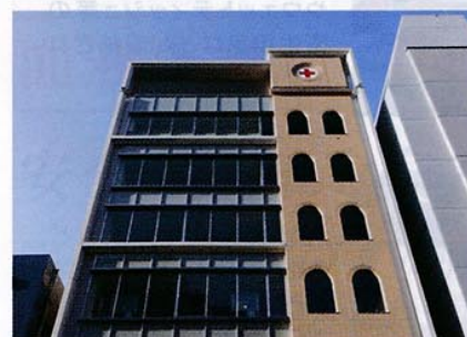
日本赤十字社神奈川県支部(横浜市中区)

全国47都道府県にある日本赤十字社の支部のひとつとして、1887年に「神奈川県委員部」が誕生(神奈川県庁内)。1896年に「神奈川県支部」と改称しました。災害救護活動をはじめ、救急法の普及やボランティア活動の推進などの拠点として活動を展開しています。さらに、県内全ての地域の人々に赤十字の活動が届くよう、赤十字事業の推進を担う赤十字担当窓口(地区・分区)を設置しています。(p.16参照)