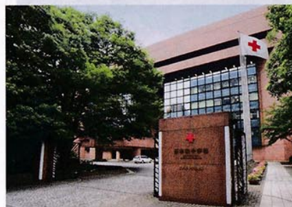
日本赤十字社本社(東京都港区)

1867年に佐賀藩士の佐野常民(初代社長)は、パリ万博の派遣団に加わり、現地で赤十字の展示を見て「敵味方の区別なく、救う」という赤十字精神に感動しました。1877年には西南戦争がおこり、多くの兵士が戦野に倒れました。佐野はアンリー・デュナンと同じ考えのもとに「博愛社」を設立し、敵味方の区別なく救護にあたりました。その後、日本がジュネーブ条約に加入し、「日本赤十字社」と改称しました。