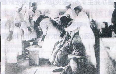
関東大震災における臨時救護