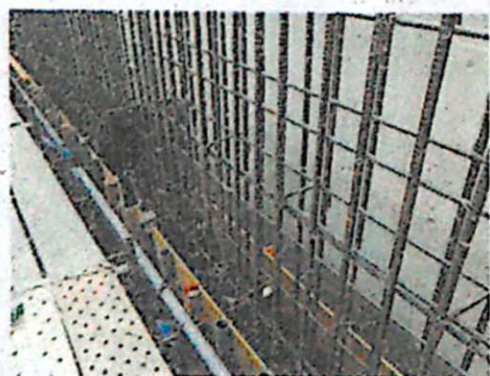
鉄筋・型枠作業(イメージ図)