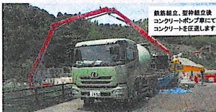
コンクリート打設作業(イメージ図)