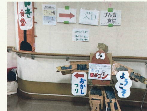
桂台地域ケアプラザの館内では、湘南桂台みどりの会さんの寄せ植えや桂台げんき食堂・グループゆうのカレーなどもありました。