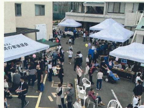
各事業所の製品やライブパフォーマンスなど、盛りだくさん！

年に1回の社会福祉法人訪問の家のイベントです！たくさんの皆さまにご来場いただき、ありがとうございました！