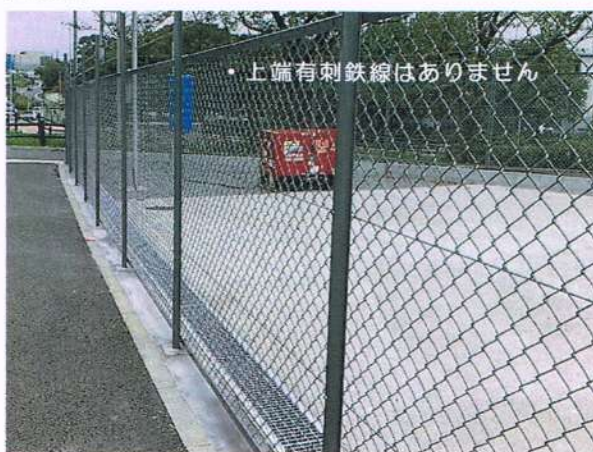
防球ネットイメージ