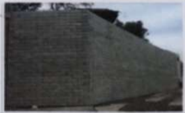
壁面工完成イメージ