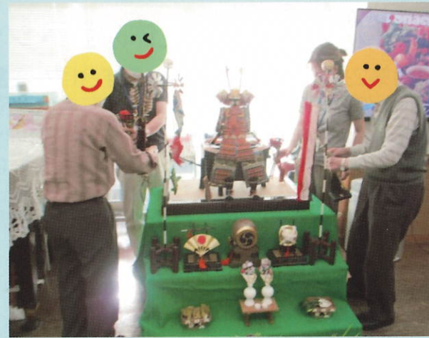
みんなで五月人形飾り