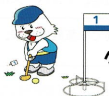
グランド・ゴルフ