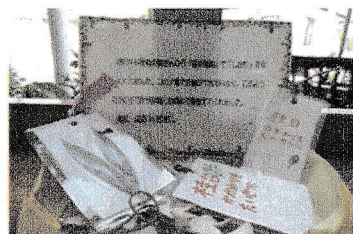
メッセージの入ったしおり

昨年度から径に定期的に来てもらい、活動や利用者さんのことを知ってもらう時間を持ち始めました。今年度は思うように交流ができませんでしたが、「桂台の時間」の授業で作った「気持ちのいいあいさつ」のポスターとしおりを届けてくれました。みんなを元気にしてくれます!