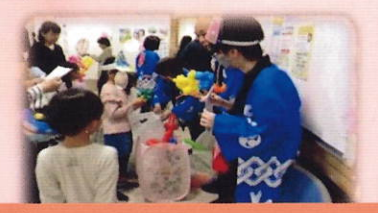
ボランティアさん 大活躍！