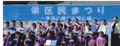
【栄区子ども青少年スポーツ・文化活動表彰】を受賞

＜今後の活動＞ ADDICT vol.7「全チーム合同発表会」が決定!! 2025.4.5(土)関内ホール(大ホール)にて