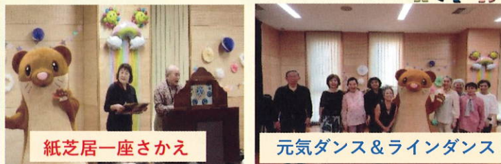
紙芝居一座さかえ