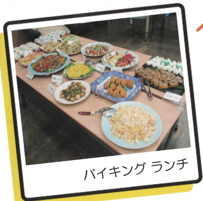
バイキングランチ