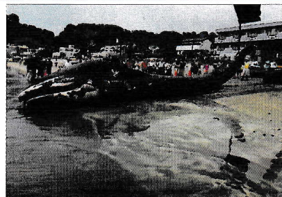
打ち上げられたくじらの赤ちゃんの胃の中からプラスチックごみが見つかった (2019年5月撮影 鎌倉市)

日常のごみ出し等で意識して取り組み、生き物にも環境にもやさしい暮らしをしませんか？