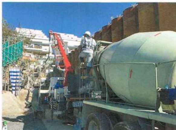
コンクリート打設作業