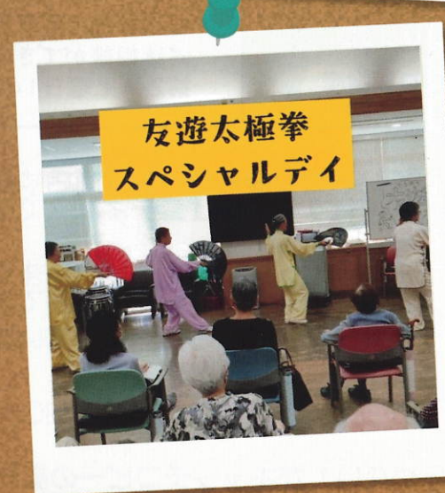
友遊太極拳 スペシャルデイ