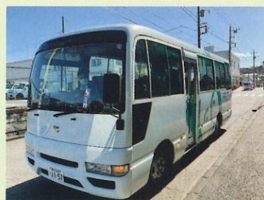
社会福祉法人 豊笑会 ライフコートさかえのバス

スローショッピングは原則第3水曜日ですが、変更もありますので、桂台ケアプラザだよりのカレンダーをご参照ください。