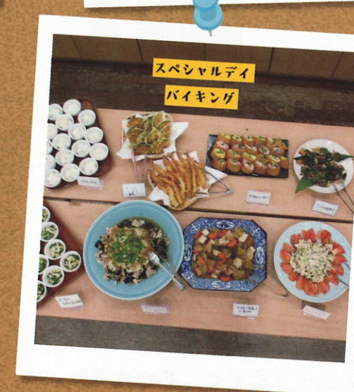
スペシャルデイ バイキング