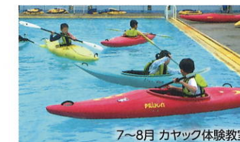
7~8月 カヤック体験教室