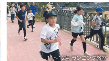
11~12月 ランニング教室

対象 小学生(保護者も参加可) 場所 本郷小学校、本郷中学校など(プログラムにより異なります)