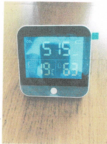
CO 2 濃度測定器