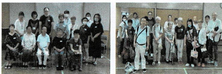
※昨年、中野ケアプラザでおこなった“つどう会”

ご登録者やご家族が地域の方々と顔見知りになる会を栄区内のケアプラザ6か所で開催しています