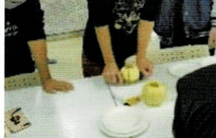
リンゴカッター 体験中

区民まつりの後、名久井農業高校の生徒と栄区の小・中・高・大学生が栄区青少年の地域活動拠点「フレンズ☆