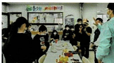
リンゴの甘さを精度計で計測

SAKAE」に集まり、南部町のリンゴ3種類を食べ比べて、それぞれのおいしさを実感しました。ちょっぴり緊張しつつも、お互いの地域の様子を話し合ったり、アイドルの話で盛り上がりつつも、若い世代間の交流の場となりました。栄区の若者たちからは「次はぜひ南部町に行ってみよう」という声も出ていました。