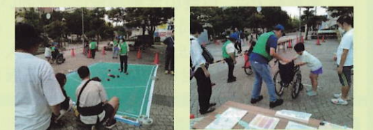
ポッチャと車椅子の体験の様子