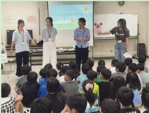
部屋の4隅 4都市クイズ