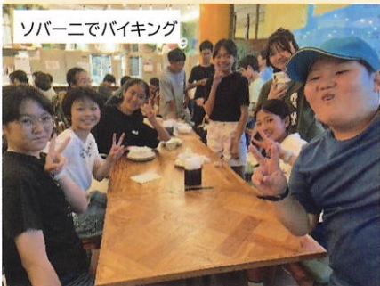
ソバーニでバイキング

丸型プランターにニチニチソウなど季節の花、四種類を栄区、栄村の子どもたちがそれぞれ一個ずつ制作し、栄村に持ち帰ってもらいました。秋には、これらの花を見て、栄村と栄区の子どもたちが共同で植えたことを思い出すことを願っています。