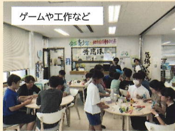
ゲームや工作など

2025年7月23日 夏休みの2日間、栄村の小中学生16名が栄区に来てくれました。フレンズ☆SAKAEで栄区の高生とゲームや様々なアクティビティで交流しました。夕食は、あーすぶらざのソバーニでバイキング、森の家に宿泊しました。翌日はみなとみらいを観光しました。