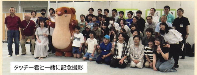
タッチー君と一緒に記念撮影