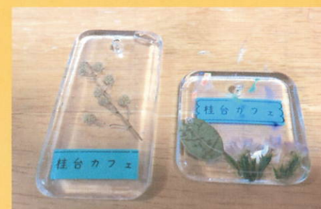
お名前キーホルダー作り