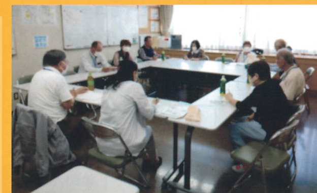
★ご家族同士で情報交換 先輩介護者からのアドバイスも！

★本人の会で楽しい工作や体を動かすレクリエーション 認知症のご本人も役割を持って活動しています。 桂台地域ケアプラザを華やかにするボランティアさん としても活躍してくださっています！