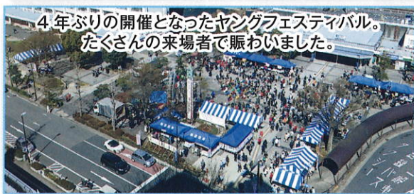
4年ぶりの開催となったヤングフェスティバル。 たくさんの方の来場者で賑わいました。