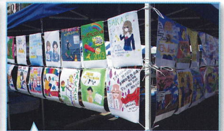
会場内に、応募いただいたポスター応募作品 すべてを展示しました。