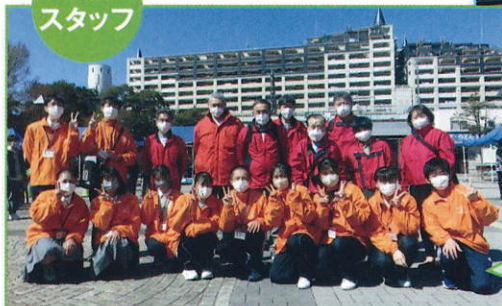
学校や学年の垣根を越えた仲間的一致団結し、 ヤングフェスを成功に導きました。