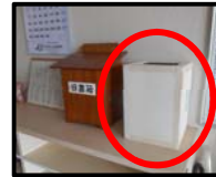
意見回収箱 ※イメージ